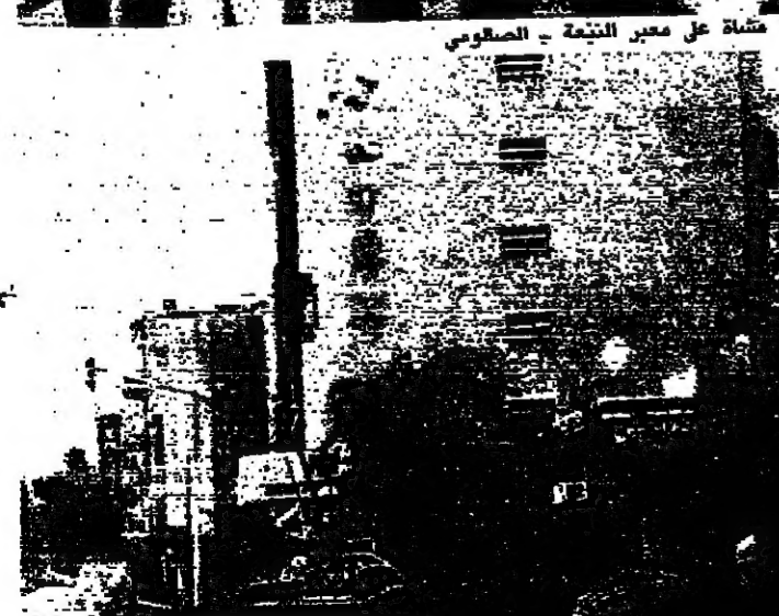
شاشة على معبر النجمة - الصالون